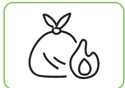
불타는 쓰레기 (생쓰레기, 비닐, 지은 플라스틱)